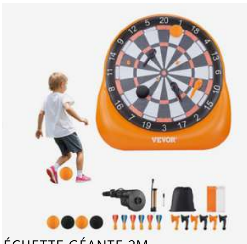
FLÉCHETTE GÉANTE 2M