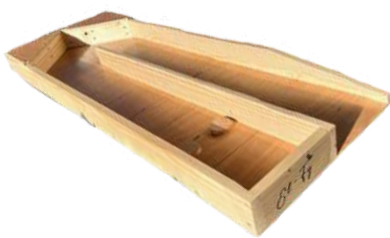
BILLARD À REBOND