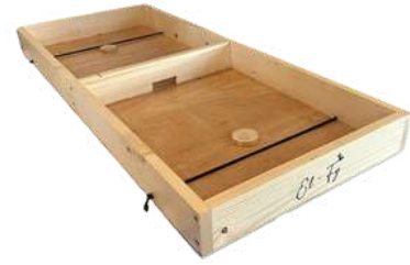
JEU DU PUNK